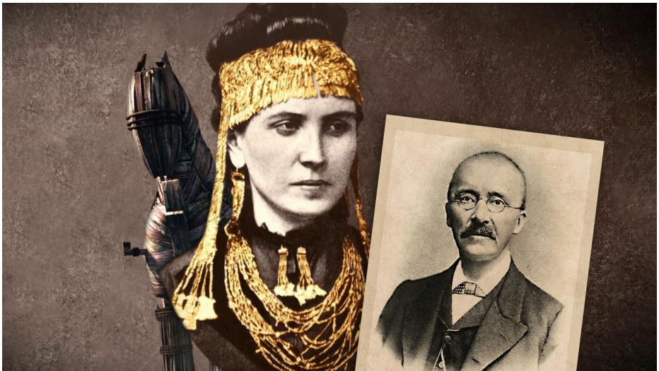
Heinrich Schliemann und der Traum von Troja

Mitteilungen der Zweigstelle Urania Murtal, 8740 Zeltweg, Feldgasse 15 Telefon: 0677-63690050 E-Mail: goja@urania.at Homepage: www.urania.at