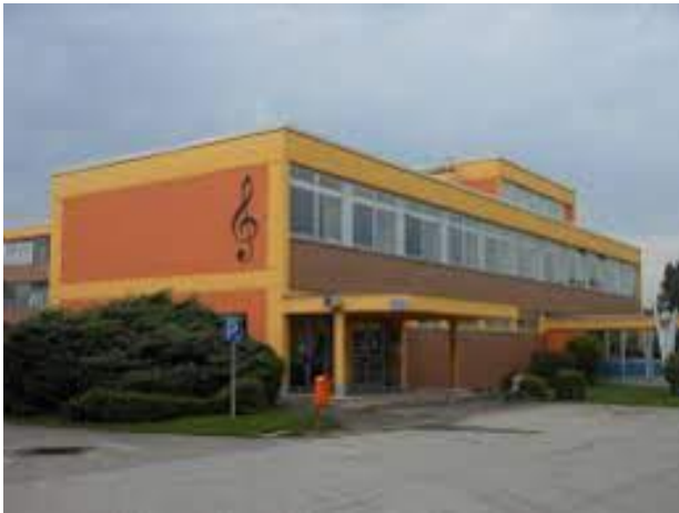
Musikschule Zeltweg, Feldgasse 15