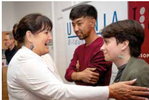
Landeshauptmannstellvertreterin Manuela Khom mit einer PSA-Absolventin und einem Absolventen

Die erfolgreiche Nachholung des Pflichtschulabschlusses ermöglicht für Personen ab 16 Jahren den Einstieg in mittlere oder höhere Schulen oder in einen Lehrberuf. Dazu bietet die Urania Lehrgänge in Graz und Zeltweg an. Landeshauptmannstellvertreterin Manuela Khom besuchte zu Schulbeginn 2025 die Urania und unterstrich die Wichtigkeit dieser Bildungsmaßnahme für die Arbeitsplatzsicherung, die soziale Integration und die Standortsicherung in der Steiermark.